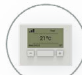
Termostato del fabricante