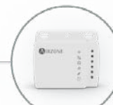
Aidoo Control Wi-Fi