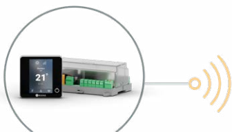
Aidoo Pro Fancoil