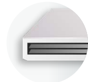
Unidades de conductos