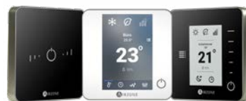
AIRZONE - THERMOSTATE

Das Gehirn Ihrer Anlage. Verwaltet alle Systembefehle. Integrierbar in Hausautomation ( KNX, BACnet, Lutron und Modbus ) dank des Airzone®-Kommunikations-Gateway .