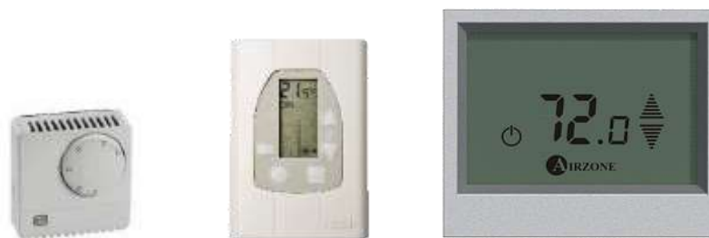
Exemple modèles Airzone « ancienne génération »

Si votre système Airzone a été installé il y a plus de 10 ans, si vous souhaitez changer vos thermostats Airzone « ancienne génération » ; nous vous proposons de renouveler votre système.